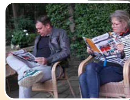
Doe me je leesbrilletje ff.