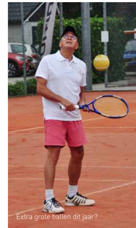
Extra grote ballen dit jaar?