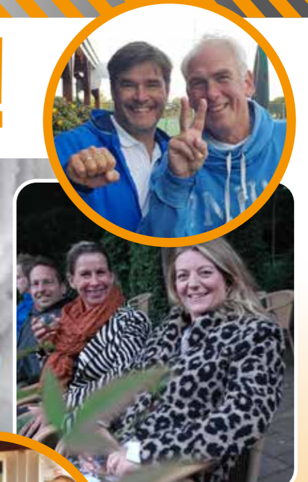
Panter en zebra ontsnapt uit Beekse Bergen.