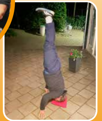
De wereld op z'n kop voor Mighty Mike.