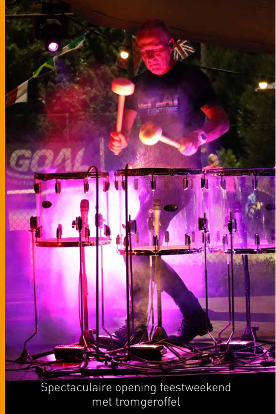
Spectaculaire opening feestweekend met tromgeroffel