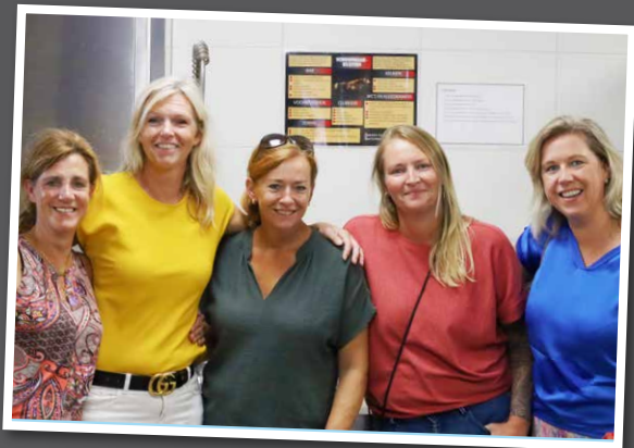
De dames van de bardienst zijn klaar voor het finaleweekend