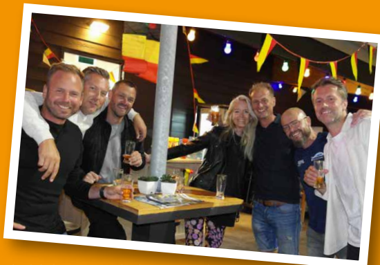
Indrinken voor de feestavond