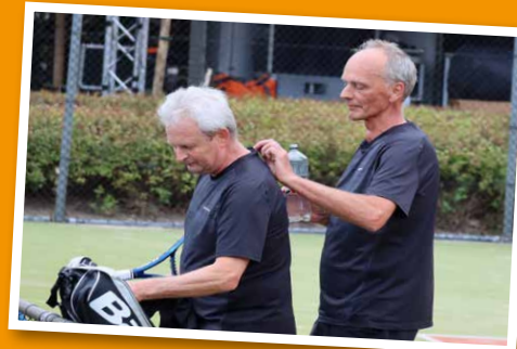
Iets hoger, ietsje lager... jaaaa lekker!