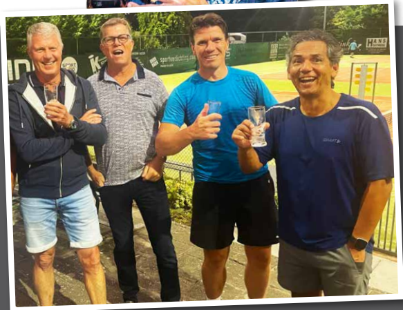
Oud Boerehofstee-leden vieren reünie