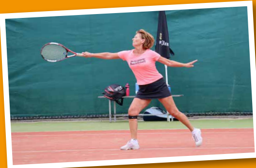
Reach out, I'll be there