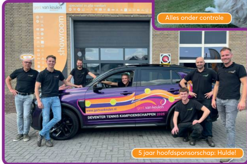
5 jaar hoofdsponsorship: Hulde!