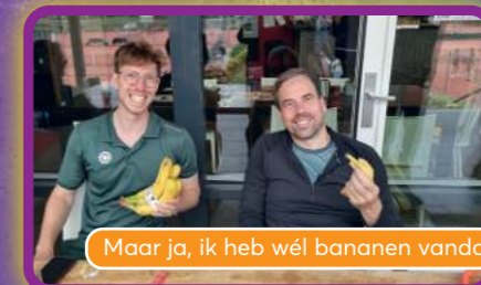
Maar ja, ik heb wél bananen vandaag