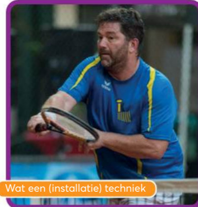
Wat een (installatie) techniek