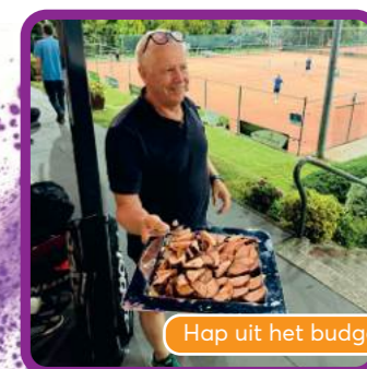
Hap uit het budget