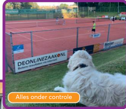
Alles onder controle