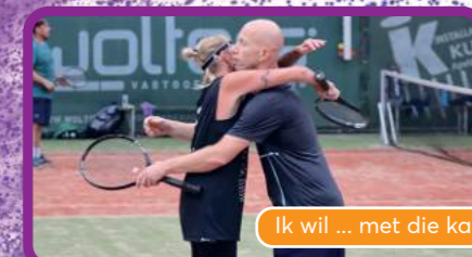
Ik wil ... met die kale